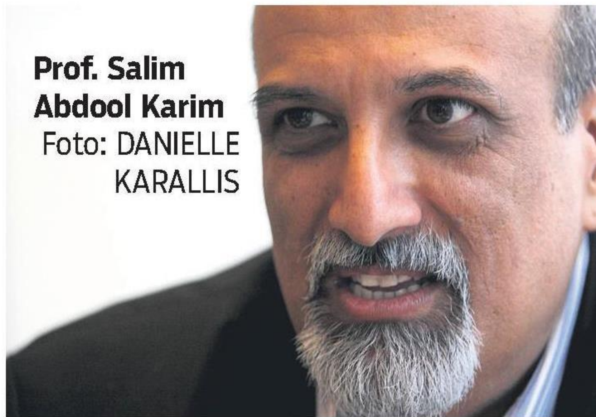
Prof. Salim Abdool Karim

Fase drie het aangebreek by Ramaphosa se instelling van die nasionale staat van inperking om kontak tussen mense waar moontlik te verminder ten